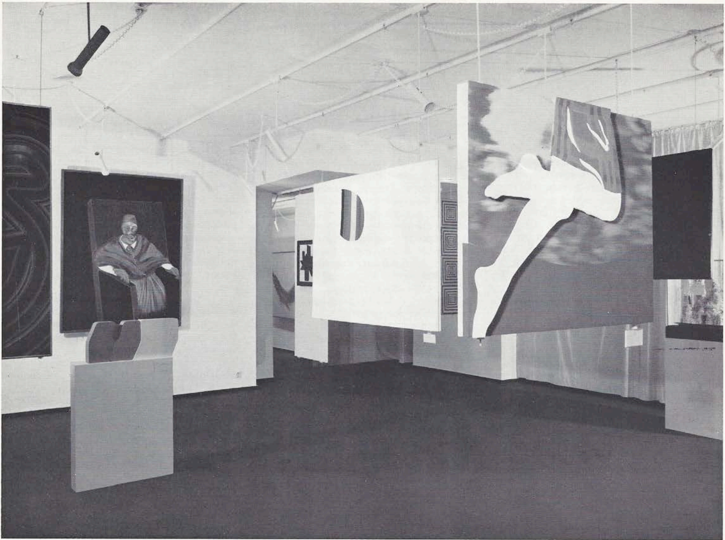
Blick in das Modern Art Museum, München (Villa Stuck) mit Bildern von F. Bacon, E. Micus, G. Ruffi, Peter Kink (v. l. n. r.) und einer Plastik von E. Micus